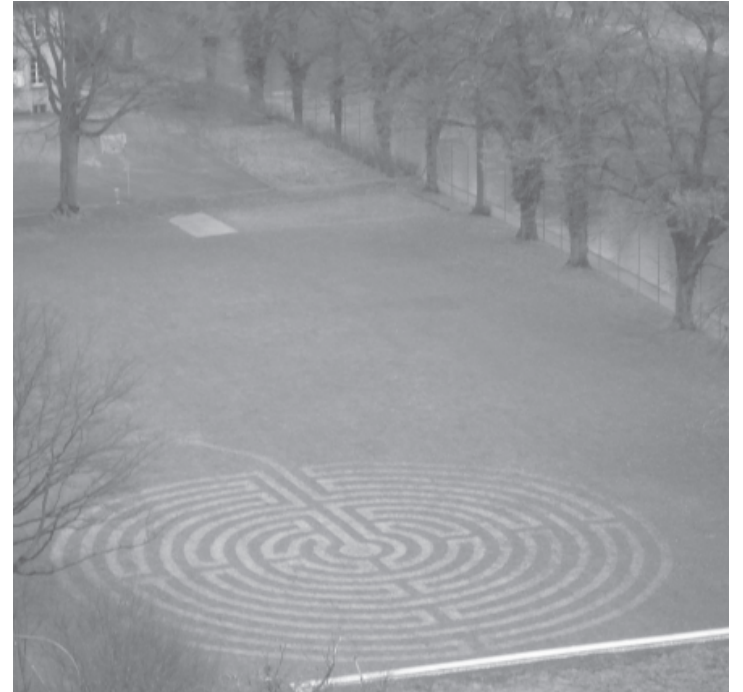
Grasmuster bei der Kornhausbrücke in Bern, Ende Februar 2012.

F. W., Bern, Schweiz (Benjamin Cremes Meister bestätigt, dass alle Muster von den Raumbüchern manifestiert wurden.)