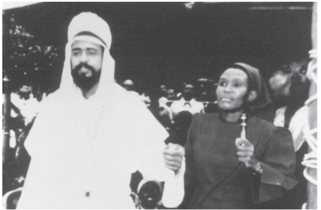
Maitreya, wie er sich im Juni 1988 in Nairobi, Kenia, vor Tausenden von Menschen zeigte.

Sie finden die Informationen über Maitreya ansprechend und möchten diese an Freunde und Bekannte weitergeben? Gerne senden wir Ihnen einige Exemplare dieser Zeitschrift kostenlos zu. Bei größeren Mengen: 4 € à 100 Stück (zzgl. Porto). Edition Tetraeder e.V., Postfach 20 07 01, 80007 München