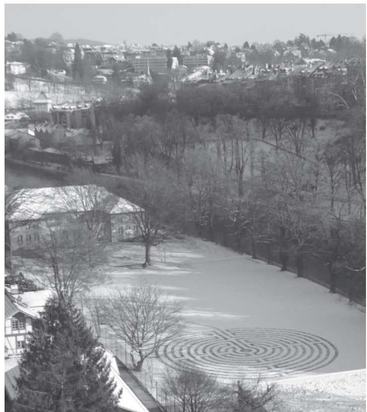
Schneemuster bei der Kornhausbrücke in Bern, Februar 2012.

A. In einer demokratischen Gesellschaft haben die Sinti und Roma ebenso das Recht, ihre eigene Lebensform zu wählen, wie alle anderen auch.